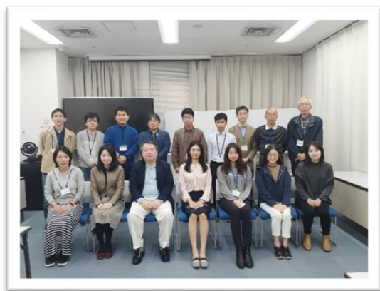
(11月1日恩田馨神戸市副市長と意見交換会)