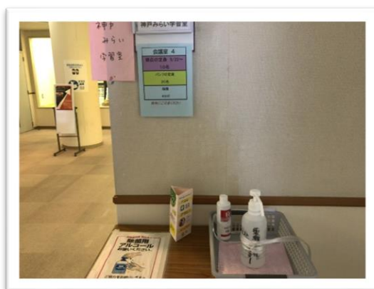
(本山校の学習室の風景(東灘区文化センター)。右の写真は新型コロナ対策の様子)