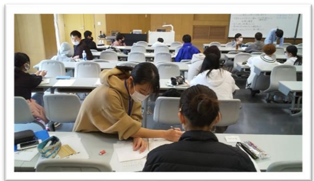
(学園都市校の学習室の風景 (UNITY 2階セミナー4室))