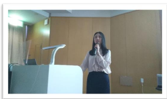
（夢ゼミ（11月兵庫県立大Uさん（対面））