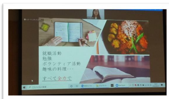
（夢ゼミ（6月神戸外大Nさん（ZOOM））