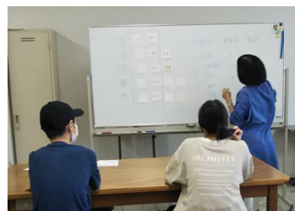
（本山校の学習室の風景（東灘区文化センター））