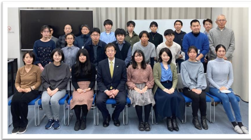
(12月12日久元神戸市長と意見交換会)

令和3年12月/大学生・スタッフ (22名) /来賓: 久元喜造神戸市長 令和4年2月/卒業する大学生等を送る会/大学生・スタッフ・顧問 (20名) /来賓: 今西正男神戸市副市長