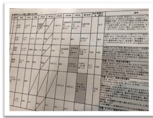
(メンタープログラム)