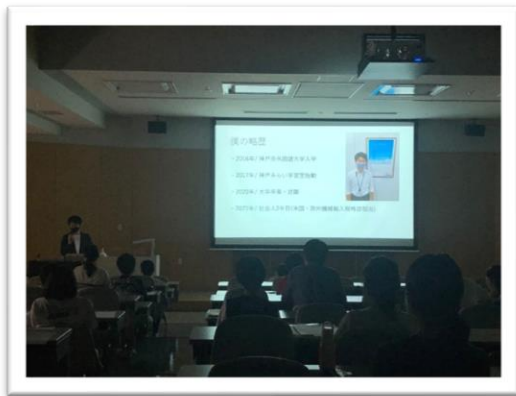
(夢ゼミ（7月社会人Nくん）)