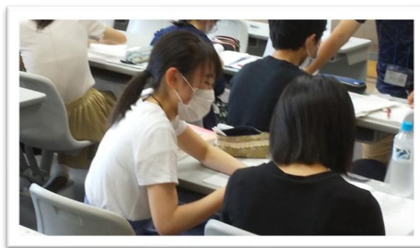
（学園都市校の学習室の風景（UNITY 2階セミナー4室））