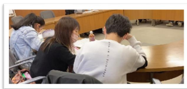
（住吉校の学習室の風景（東灘区文化センター））