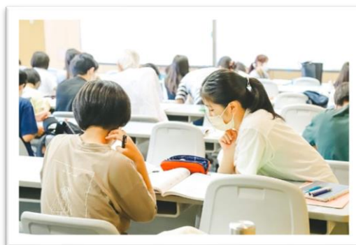
（学園都市校の学習室の風景（UNITY セミナー4室））