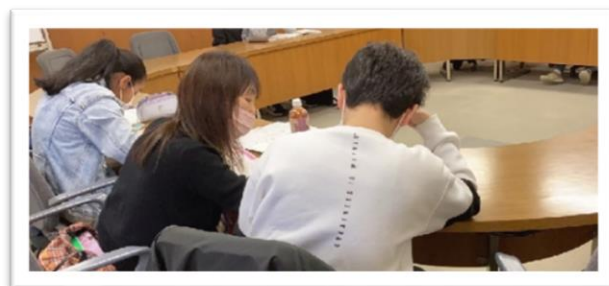
（住吉校の学習室の風景（東灘区文化センター））